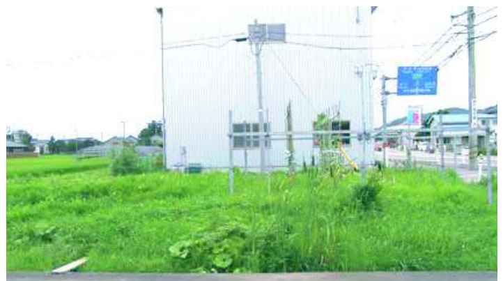
草が生い茂って野菜の苗をさがしている始末です。(笑)

昨年と同じ場所になすびを植えましたが、ぜんぜん苗が成長しなくて枯れていってしまいました。