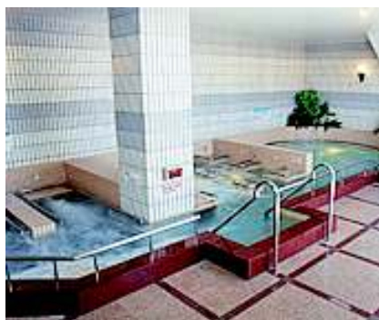
ジェットの泡が出る各湯

すが、なんか増えていまして空気の泡が出るところがいっぱいあり、ぐるぐる歩くところから、立っていたらいろんな方向から強いジェット噴流のような泡が出てきてお腹などのエステになるところとかプールなどが増えたと思います。「泡が強かったー」と言うイメージです。