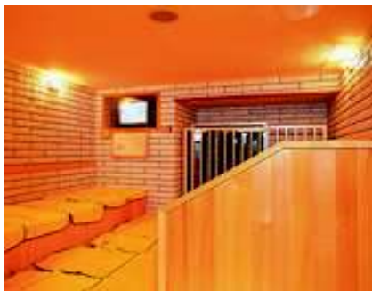
これが好きなんです